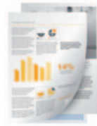
Zuschließen von Dokumenten